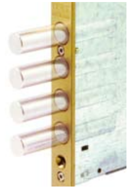
Proyección bulones: 36mm