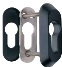
Détail de l'écusson E210