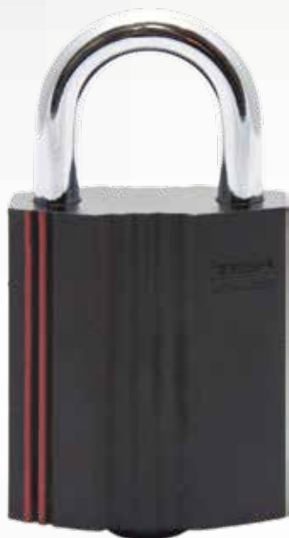
Candado N315 eCLIQ