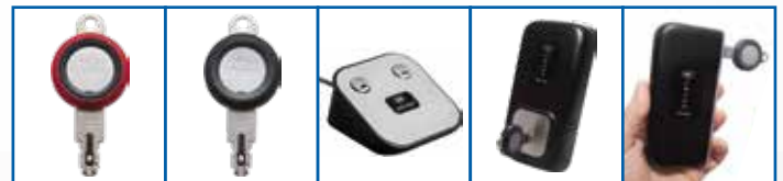
Llave eCLIQ Programadora