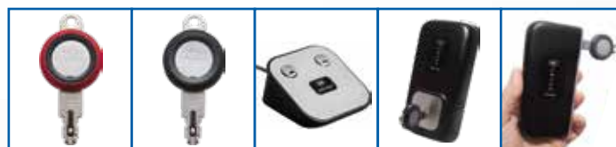
Llave eCLIQ Programadora Llave eCLIQ Dinámica Desk PD Wall PD Mobile PD