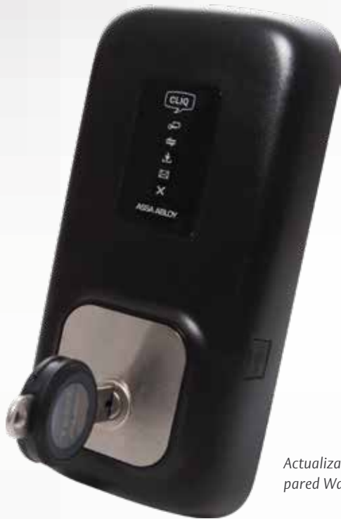
Actualizador de pared Wall PD