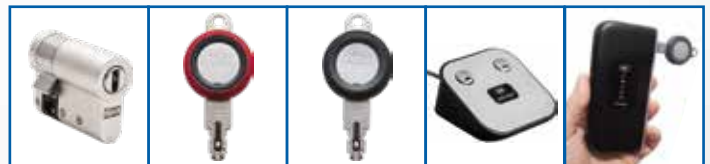
Cilindro eCLIQ Llave eCLIQ Programadora Llave eCLIQ Desk PD Mobile PD