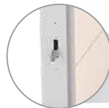
6 puntos de cierre independientes