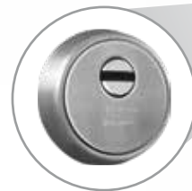
Doble escudo antiextracción