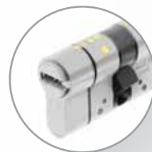
Cilindro de seguridad T70