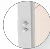
Bulones de 18 mm